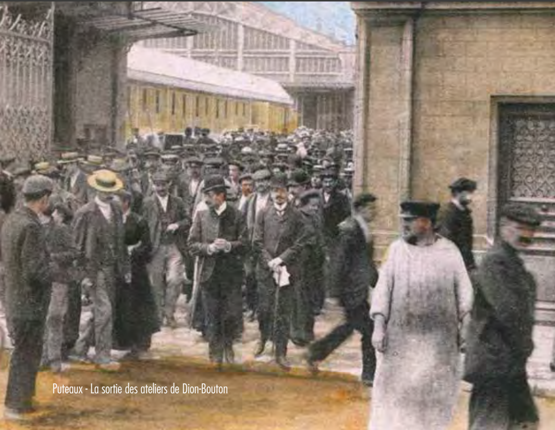
Puteaux - La sortie des ateliers de Dion-Bouton