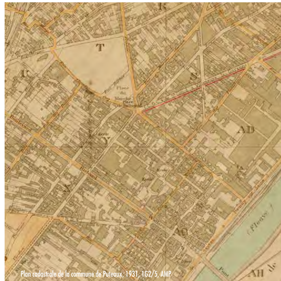
Plan cadastrale de la commune de Puteaux, 1931, 1G2/5, AMP

3 - Reprenez la rue Chantecoq jusqu'à la place Simone et Antoine Veil au bout de l'esplanade. Saurez-vous retrouver l'ancien nom de cette place sur le plan cadastral ci-dessus ?