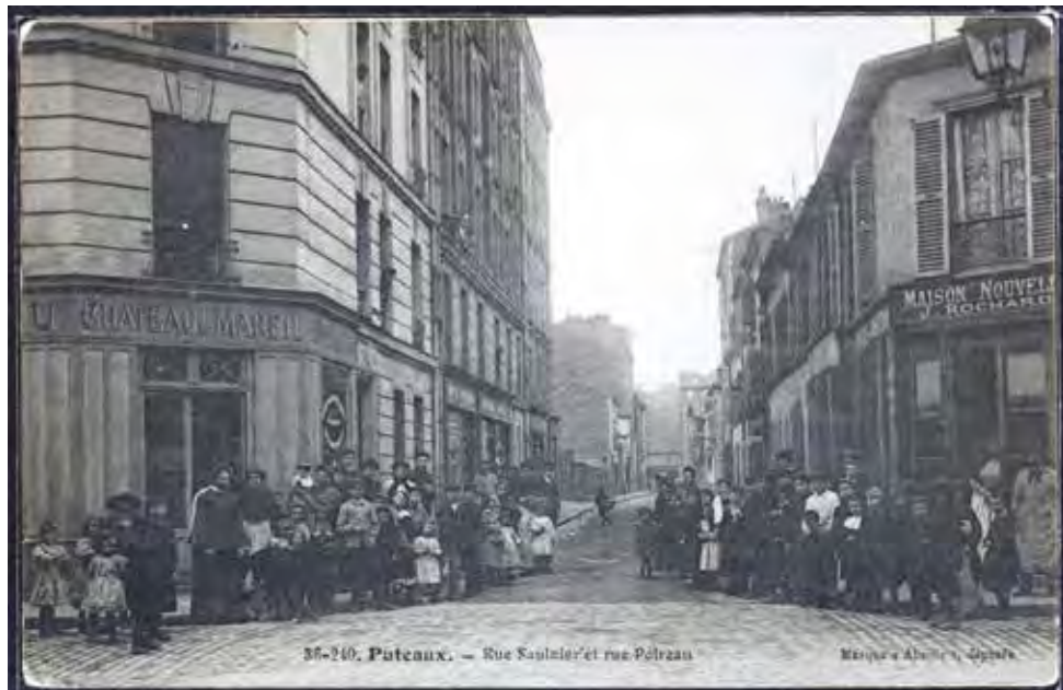
Carte postale du croisement de la rue Saulnier avec la rue Poireau, s.d., 2Fi131, AMP