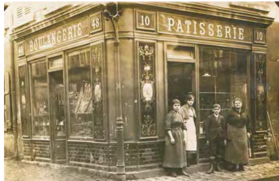
Carte postale d'une boulangerie-pâtisserie rue Voltaire, s.d., 2Fi1497