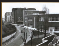
École Marius Jacotot, vers 1938, 2F1430, AMP.