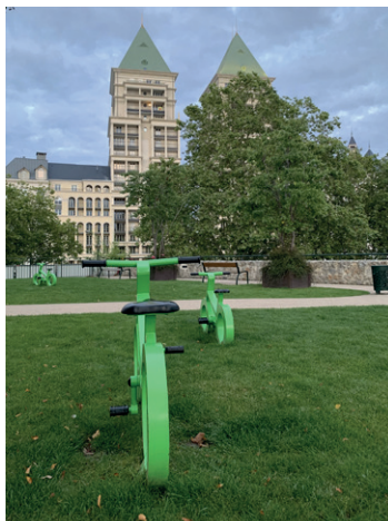
ÉcoQuartier des Bergères