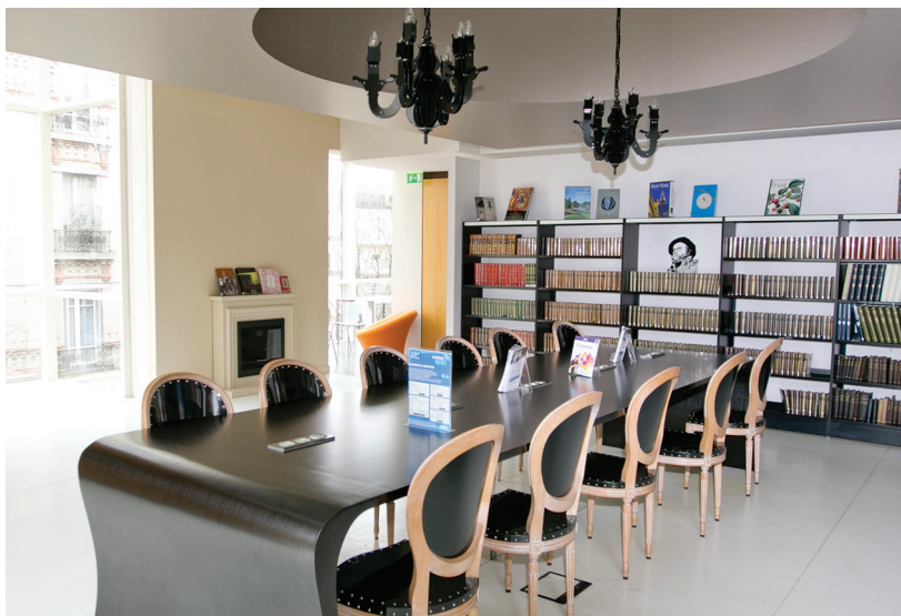
Salle d'étude du Palais de la Médiathèque