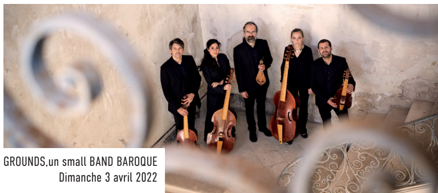
GROUNDS, un small BAND BAROQUE Dimanche 3 avril 2022

La Musique des sapeurs-pompiers de Paris Dimanche 30 janvier 2022