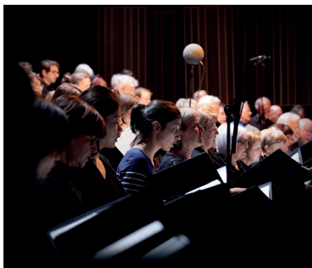
LA SYMPHONIE DE L'ESPACE

J'vous ai apporté des chansons Dimanche 19 septembre 2021