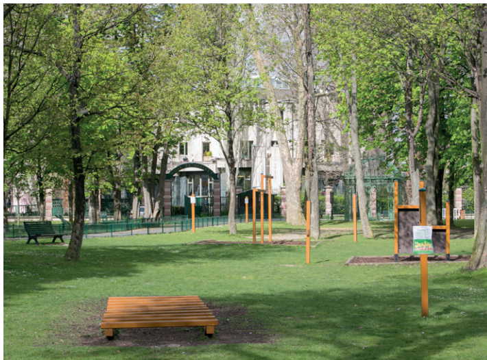
Île de Puteaux

Des agrès sportifs en accès libre sont à votre disposition.