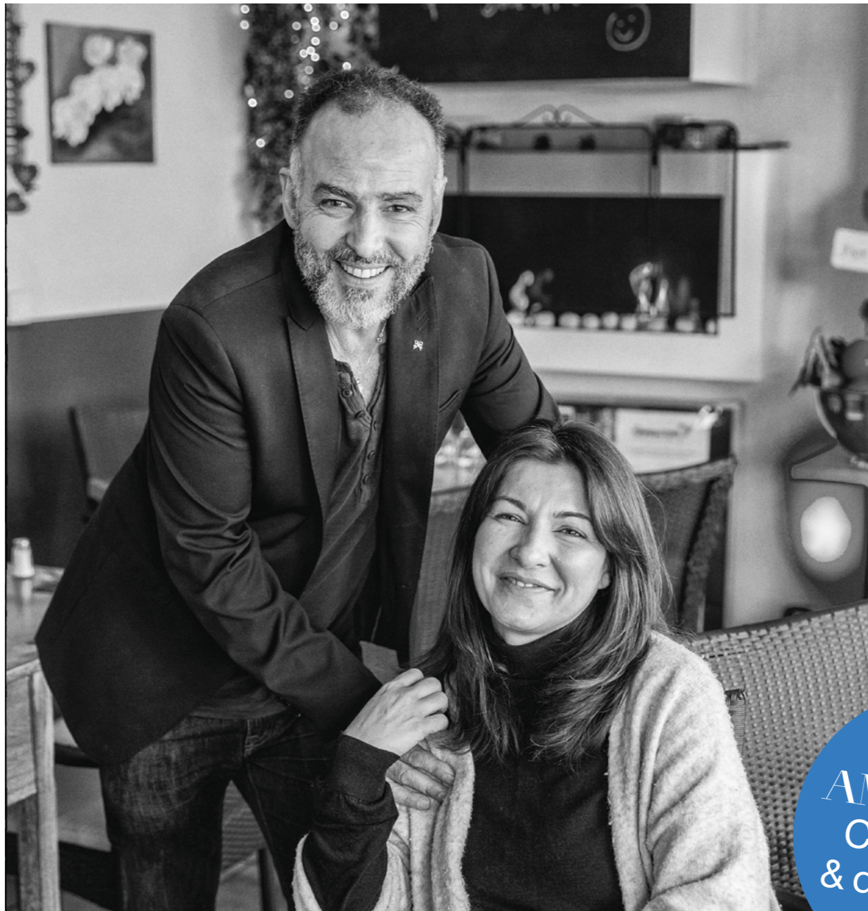
' A PRESTU (à bientôt en corse) '