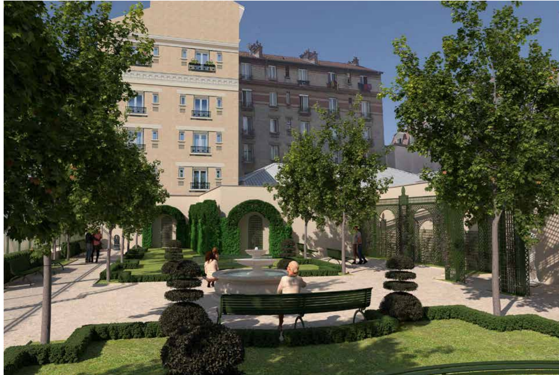
VISUEL D'INTENTION-NON CONTRACTUEL