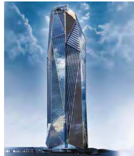
LA TOUR HEKLA