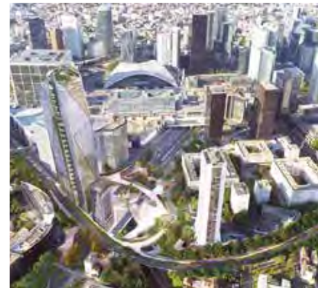
LA ROSE DE CHERBOURG

Le Campus Cyber , excellence de la Cybersécurité française, s’installe à La Défense dans la Tour Eria à Puteaux. Premier campus européen de cybersécurité, il regroupe dans un même lieu start’ups innovantes et acteurs majeurs de la cybersécurité. Cet immeuble, de 26 000 m 2 accueillant environ 1 000 personnes, est un nouveau lieu pour attirer et réunir les talents. C’est une opportunité pour les jeunes d’accéder à des formations dans des métiers d’avenir à la pointe de la technologie.