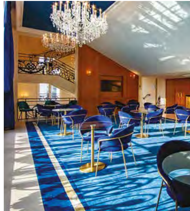
LE BAR DU THÉÂTRE