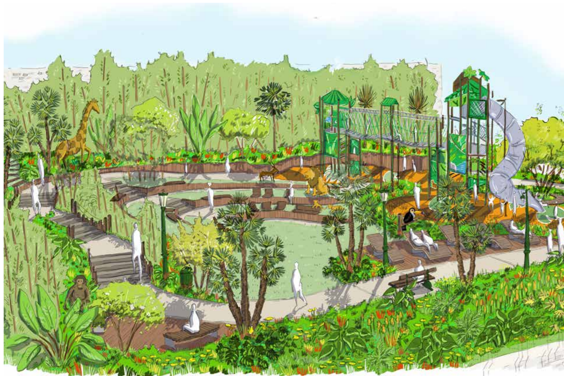
DESSIN D'INTENTION-NON CONTRACTUEL