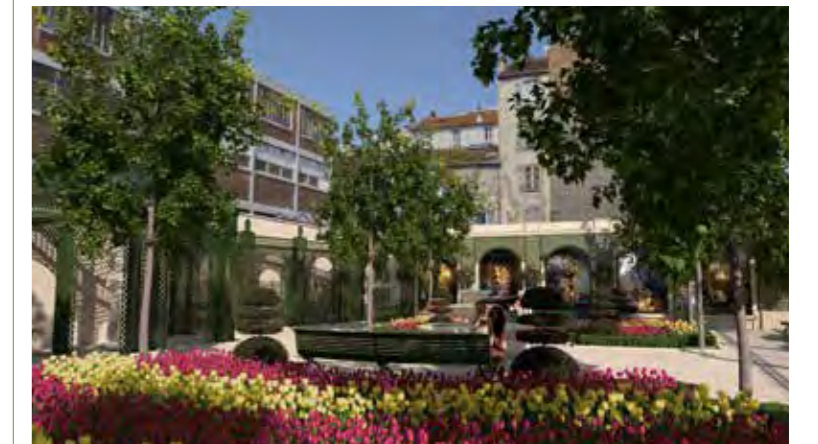
VISUEL D'INTENTION-NON CONTRACTUEL

MÉCÉNAT RECHERCHÉ • Mécénat financier • Mécénat en nature