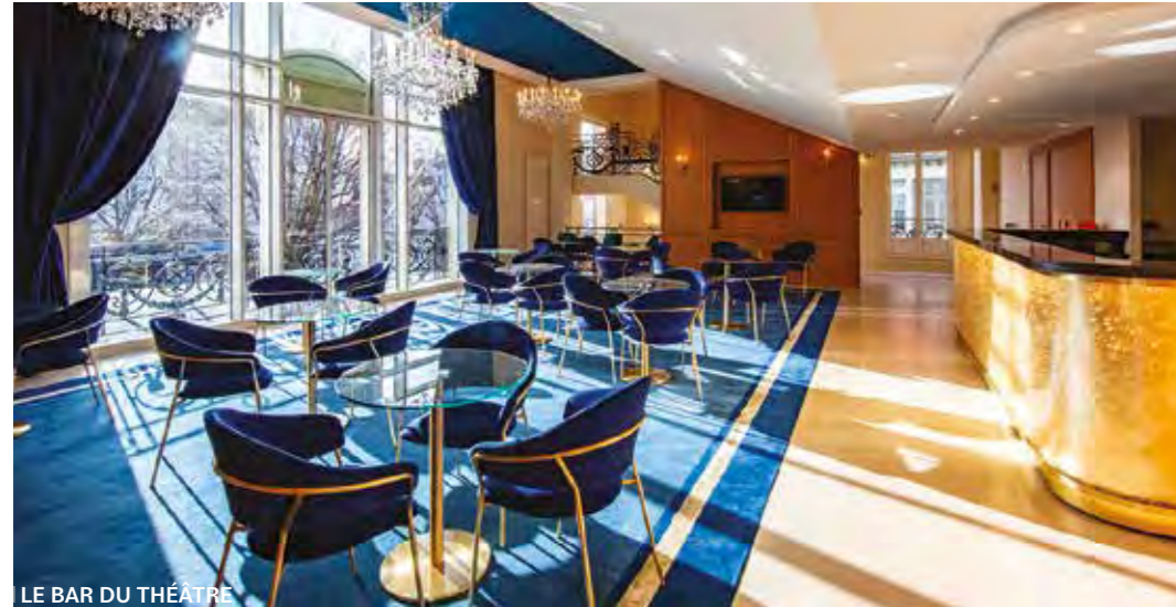
LE BAR DU THÉÂTRE